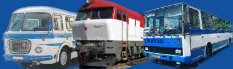
Změna vozidel vyhrazena. Ilustrační fotografie.

První dva prototypy nových traťových motorových lokomotiv T 478.1 byly v ČKD vyrobeny v roce 1964 a na jaře roku 1965 nasazeny do zkušební provozu. Výrazně tvarované čelo z laminátu dalo lokomotivám jméno „Bardotka“. Charakteristický zvuk motoru k nám jezdí obdivovat nadšenci z celého světa. První vyrobená lokomotiva T 478.1001 je domovem v Brně.